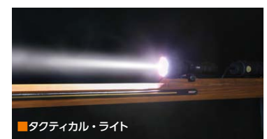
タクティカル・ライト

軍事規格によるベースですので、自動小銃に装着するタクティカル・ライトであれば、すべて装着可能です。